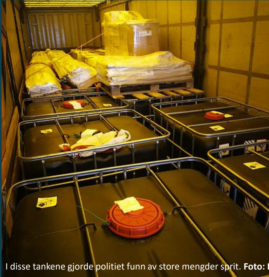
I disse tankene gjorde politiet funn av store mengder sprit.

OP OPSON i 2020 beslagla Tolletaten i samarbeid med politiet 5600 liter falskt brennevin som var ment for det norske markedet. Varene var deklarerert for Tolletaten som håndsprit til desinfeksjon..